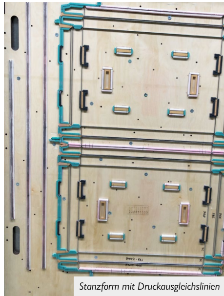
Stanzform mit Druckausgleichslinien